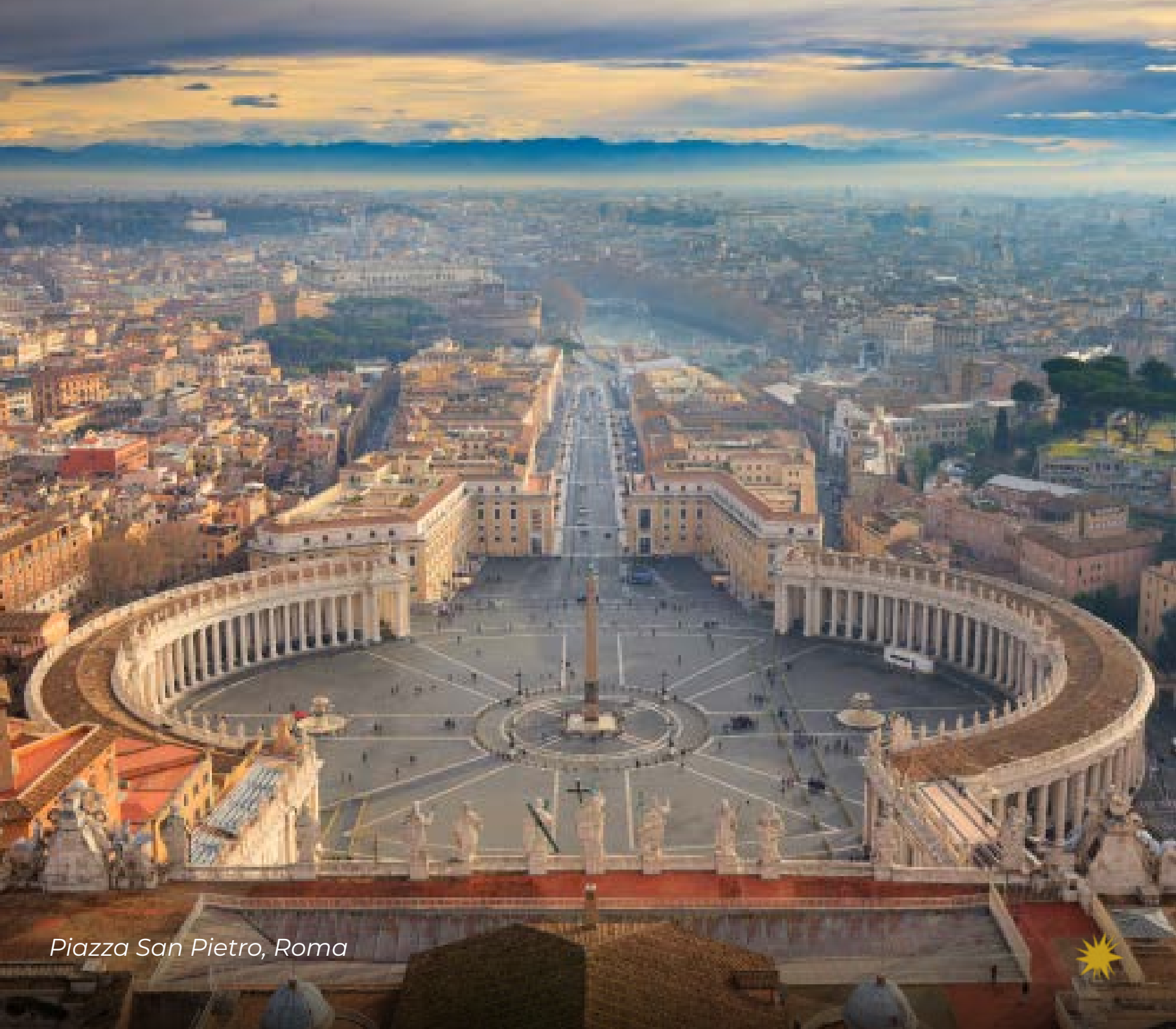
Piazza San Pietro, Roma