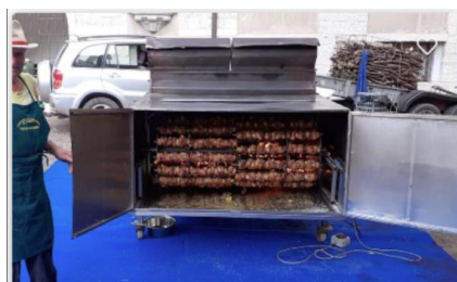
GAZER EN ROCCA - SPIEDO EDITION

Servizio di vendita e ticketing esperienze e eventi organizzati in occasione di diversi eventi