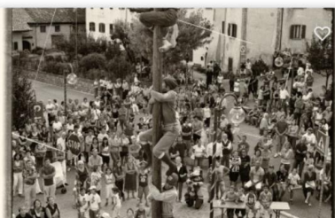
SAGRA DEI MOZAC