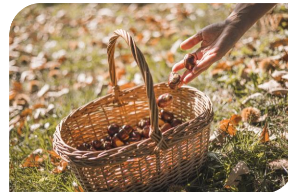
PROGETTO MESE DEL GUSTO