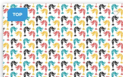
GAMBERI, FESTIVAL DELLE ACQUE